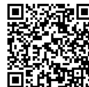
▲經濟不利 助學金捐款單