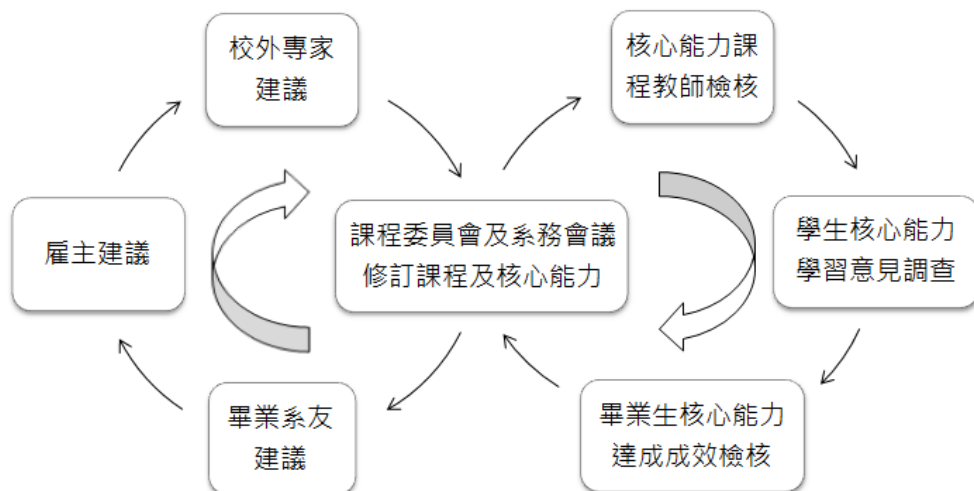
圖 5-4-1. 本系所檢討改善核心能力、課程、教師與學習評量機制

本系持續透過各項機制，蒐集並根據內部利害關係人、畢業生及企業雇主對學生學習成效之意見，修訂本系核心能力、課程規劃與設計，並作為教師教學與學習評量等之檢討改善參考(圖 5-4-1)：